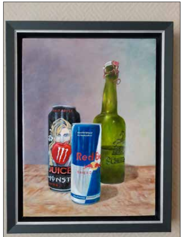
Eerste en tweede Pinksterdag (24 en 25 mei) van 11.00 tot 17.00 uur expositie van realistische schilderijen bij Theo Berkers, Rivierensingel 209 in Brouwhuis.