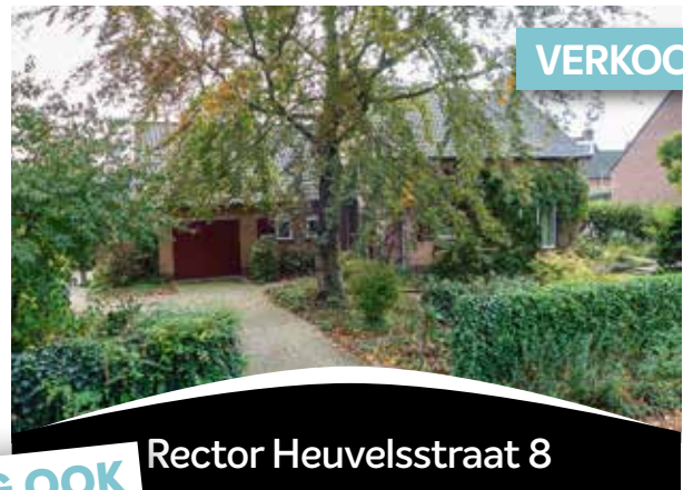
Rector Heuvelsstraat 8