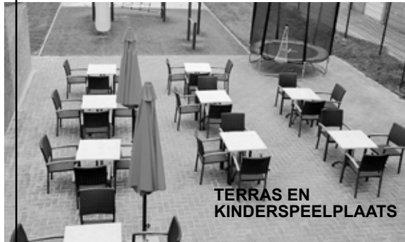
TERRAS EN KINDERSPEELPLAATS

* Kleine Kroepoek * Mini Loempia's * Sate 2 st. * Babi pangang * Foe Yong Hai * Kipfilet champignons * Met witte rijst i.p.v. witte rijst met nasi of bami € 0,70 p.p. Heeft u allergie? AUB doorgeven!