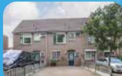
Verkocht o.v. Twentehof 25

Bel voor een gratis en vrijblijvend kennismakingsgesprek en verkoopadvies