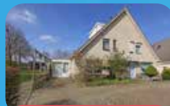
Verkocht o.v. Brabanthof 36