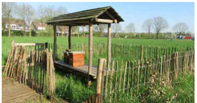
In gebruik genoemen bijenhotel

De waarden waar wij ons op baseren zijn: cultuurhistorie, biodiversiteit, duurzaamheid en educatie. Wij proberen oude cultuurhistorische elementen terug te brengen in het gebied. Op ons wensenlijstje staat bijvoorbeeld het aanplanten van een boomgaard met oude-ras-fruitbomen, het laten grazen van oude vee-rassen. Biodiversiteit wordt na-