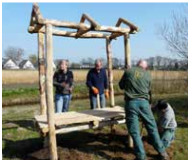
Plaatsen van een insectenkast op Kloostereind

Oorlog en bevrijding. In de komende nummers van de Corridor zullen we Brouwhuizenaren die tijdens de oorlog zijn omgekomen speciaal gaan herdenken. Meer weten? Dit op pag. 12